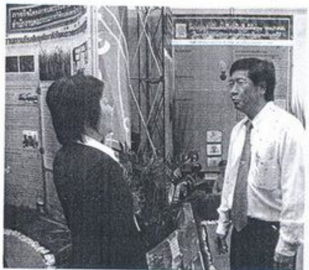
นำเสนอผลงานในงาน Thailand Research Expo 21

ข ้อก้นพบ การดำเนินวิสาหกิจชุมชนต้องมีการเรียนรู้อย่างต่อเนื่อง และรู้สึกในสาขาที่ทำ ต้อง “รู้ สู่ ระวัง” และ “4 ม.” ได้แก่ 1) ไม่เสี่ยงมาก 2) ไม่ตื่นตระหนก 3) ไม่มีหนี้สิน และ 4) มีความสุข มีการจัดการวิสาหกิจชุมชนแบบค่อยเป็นค่อยไป บนพื้นฐานของบทเรียนที่ผ่านมา มีการปฏิบัติที่ดี มีความรับผิดชอบต่อสังคม เน้นความซื่อสัตย์ ความสามัคคีของหมู่คณะ และต้องสร้างการออมเป็นสิ่งสำคัญ